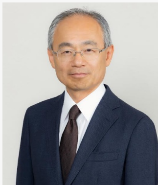
福井大学 医学系部門 医学領域 形態異能医科学講座 解剖学 教授