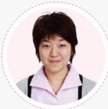
福井大学 教育・人文社会系部門 教員養成領域 発達科学講座 教授

教育学部では専攻する科目によって必要スペックは違います。どの科目でもある程度対応できるような、汎用性の高いパソコンを選択しましょう。