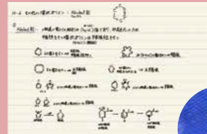
新3年 中村 そよか