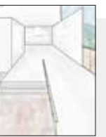
実際に先輩が書いたパス (手書きの図)