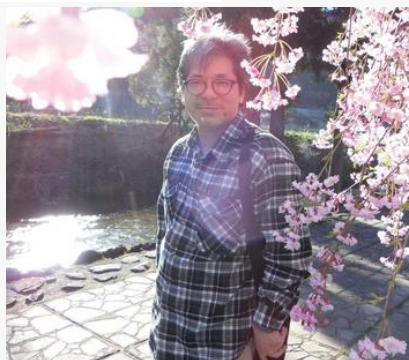
福井大学 工学系部門 工学領域 情報・メディア工学講座 准教授

大学や学会ではまだVGAが使われていることもあり、VGAとHDMI両方ついているのが良い。